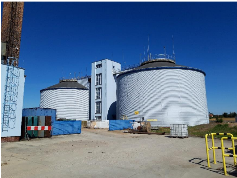
Przykładowe zdjęcia wyremontowanego w 2010 roku WKF nr 2