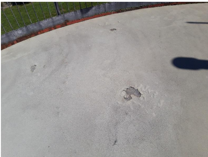
Uszkodzenie warstwy wierzchniej kopuły galerii WKF